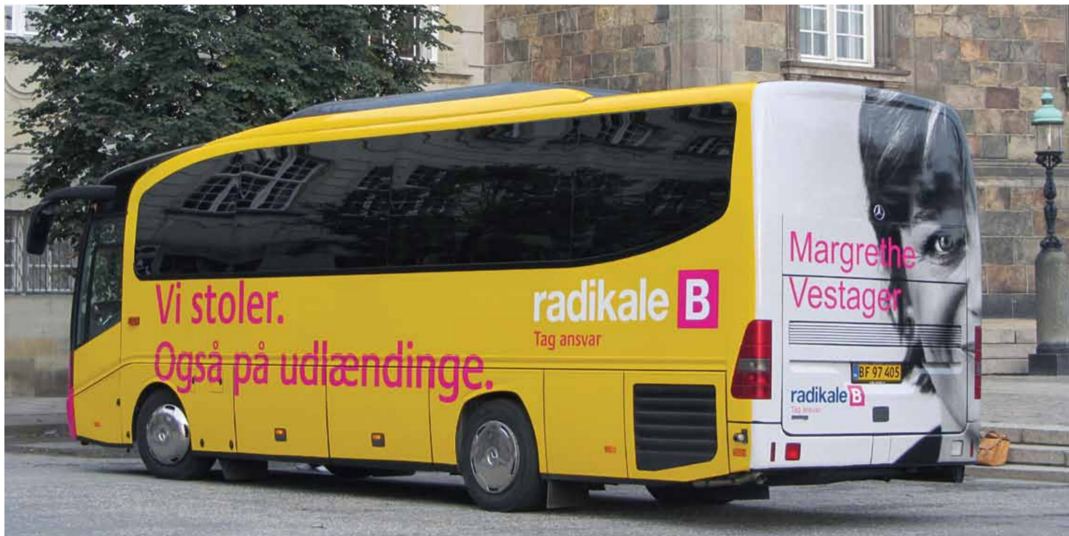
Valgbussen er et af de mest synlige resultater af Radikale Venstres valgfond.