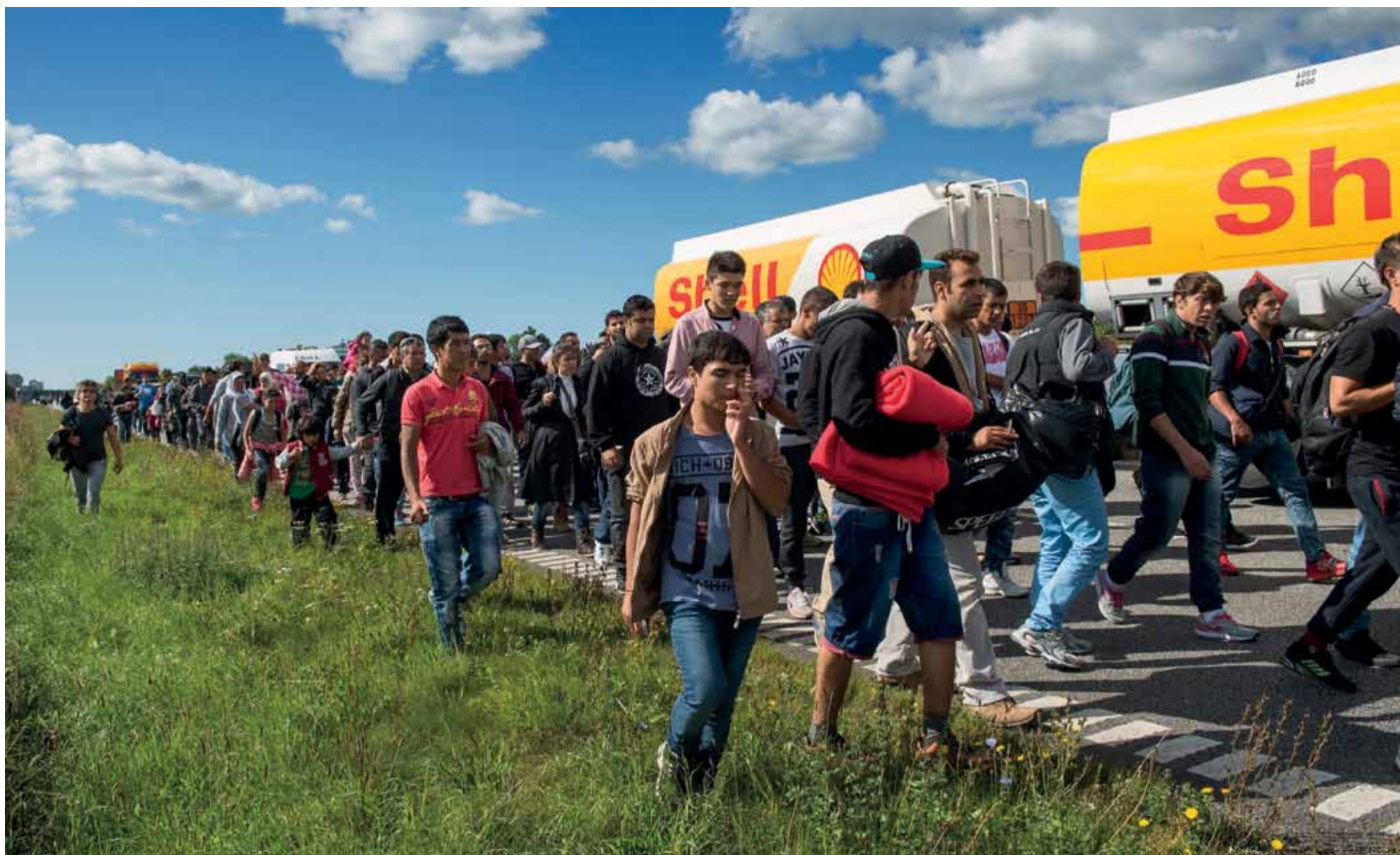
Flygtningekrisen er på dagsordenen, når Radikale Venstre inviterer medlemmer, eksperter, politikere, journalister og andre til nytårsstævne 9.-11. januar.