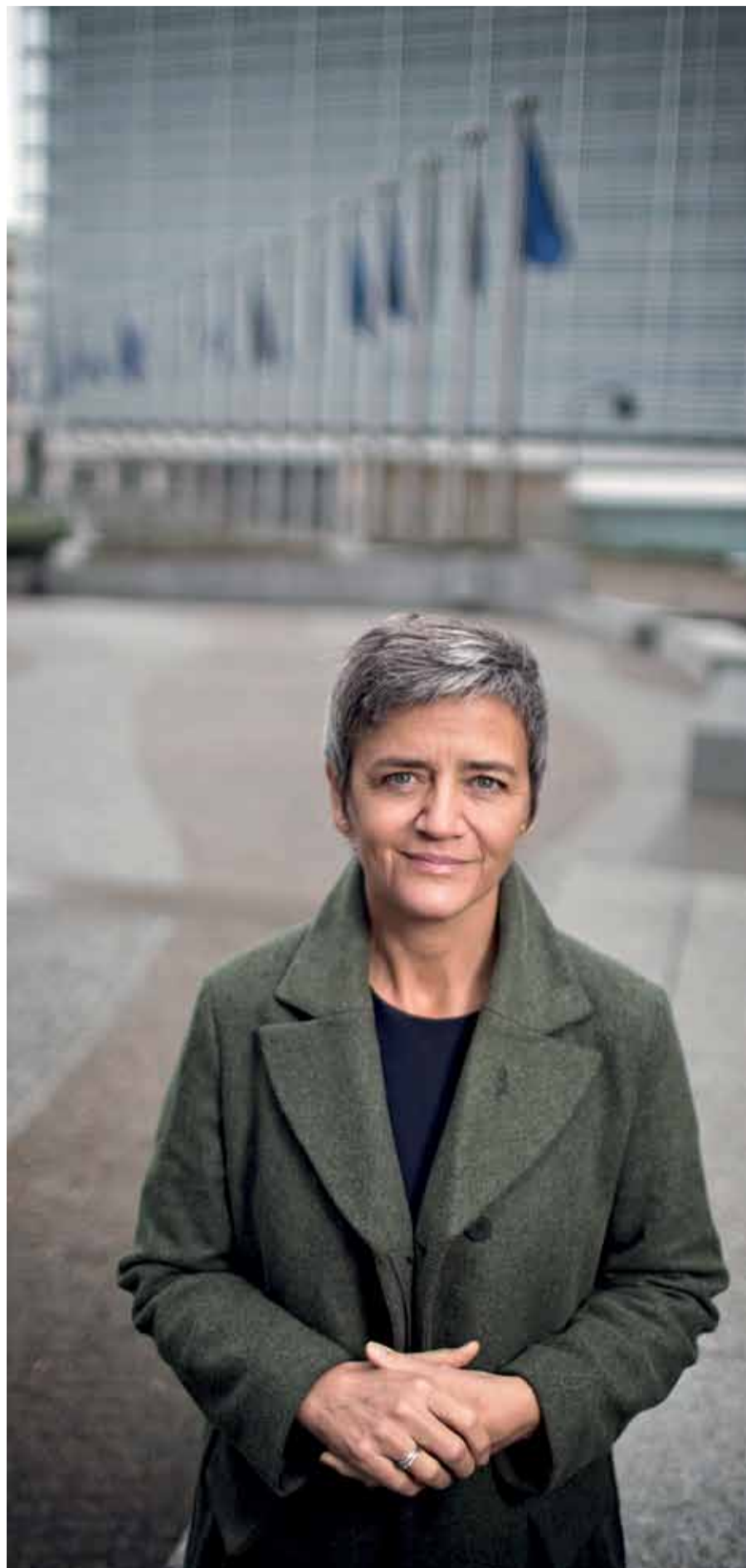
I Bruxelles har Radikale Venstres tidligere leder Margrethe Vestager både arbejdsmæssigt og privat taget hul på et nyt kapitel i sit liv.

mere på eksisterende lovgivning i stedet for nødvendigvis at give sig i kast med ny lovgivning: